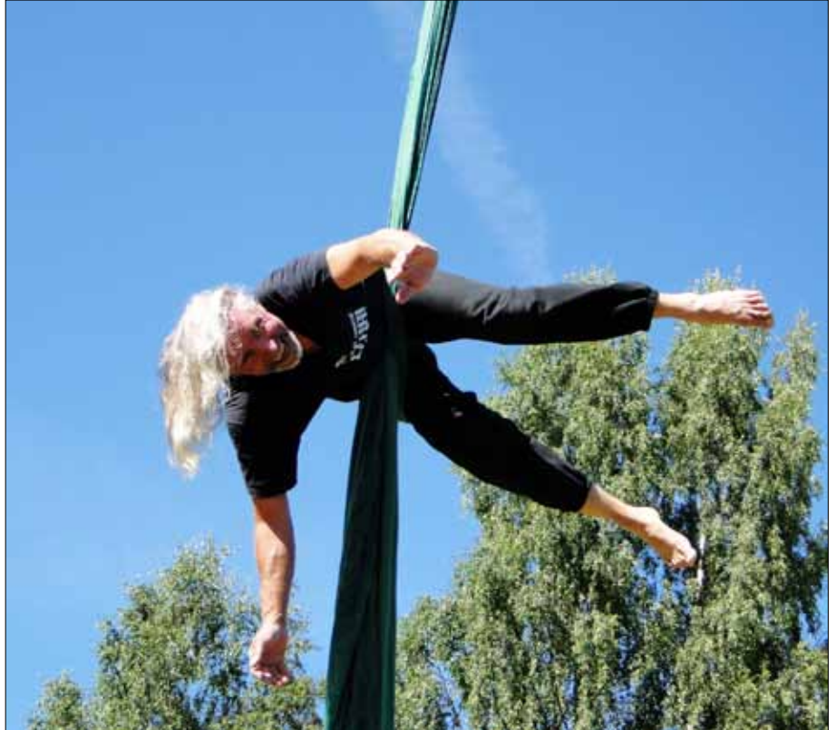
Kuva yllä: Viidenkymppin villitys tämäkin.