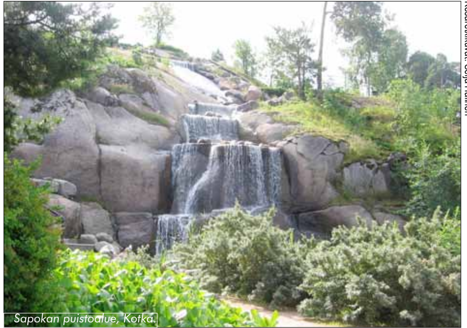
Sapokan puistoalue, Kotka.