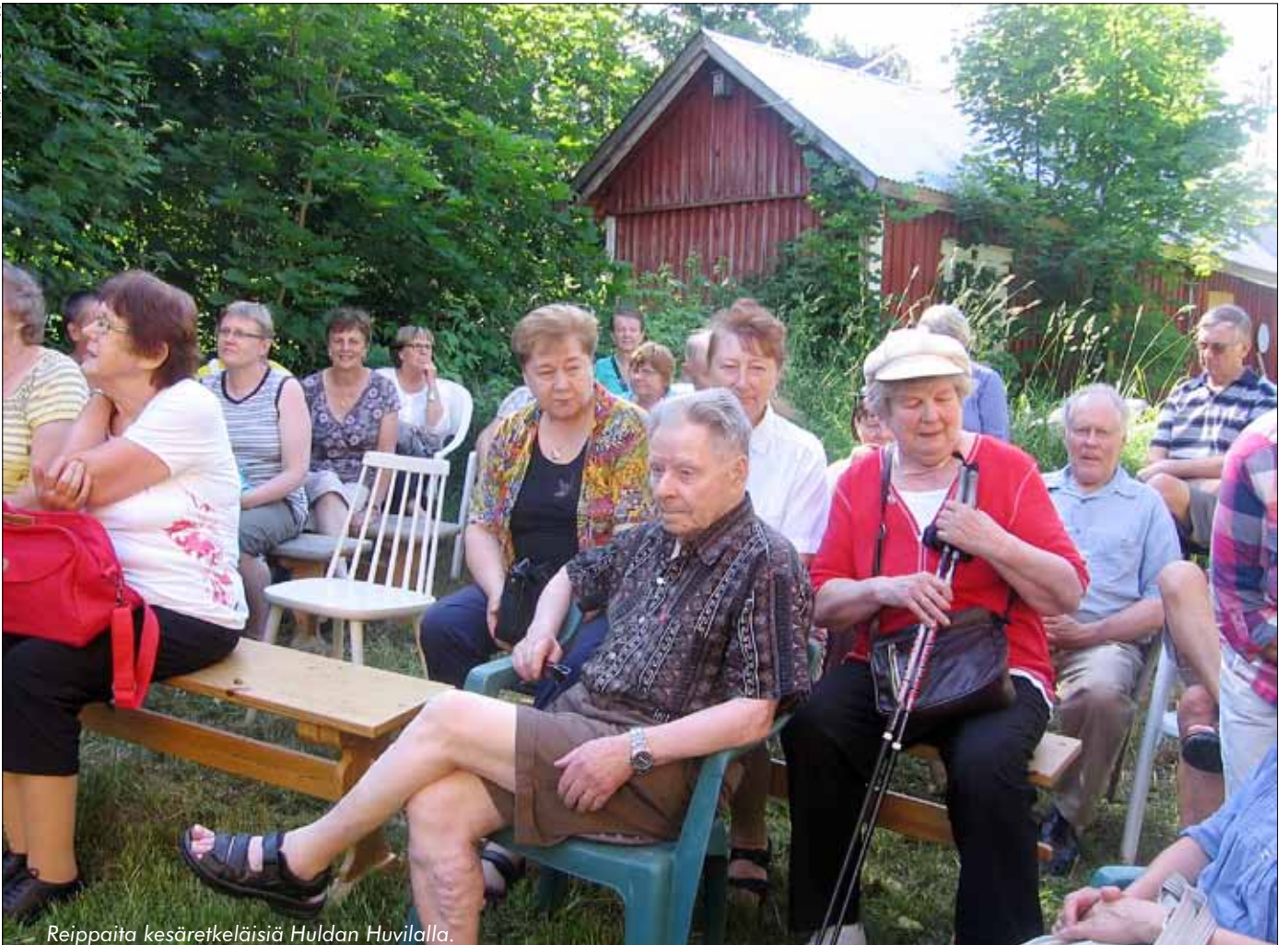
Reippaita kesäretkeläisiä Huldin Huvilalla.