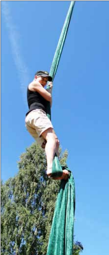
Kuva alla: Tarvitaan vain traktori, puomi, paljon kangasta ja ennakkoluuloton mieli!