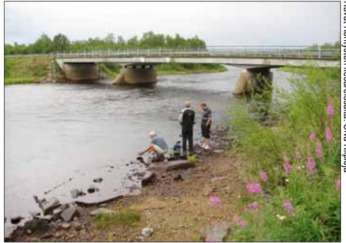
Kuvat Köhtysen kesäreissulla: Oiva Kiljoja