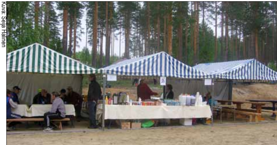
Kuva yllä: Avoimet kahden keskimatkan kansalliset suunnistuskilpailut kisattiin 6.8.2011 Tasasenkaan maaostoissa. Sarvenperäset ry oli paikalla muonittamassa yleisöä ja kilpailijoita.